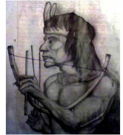
el indio Tacuabé

El 11 de Abril de 1831, Fructuoso Rivera, Presidente de la República de Uruguay, convocó a los principales caciques charrúas y sus tribus a una reunión en un bucle formado por el arroyo Salsipuedes, el pretexto para reunirlos era que los necesitaba para cuidar las fronteras del Estado. Según los relatos de la época, los charrúas fueron agasajados, emborrachados y atacados por una tropa compuesta de 1200 soldados, a resultas de la refriega murieron 40 indios y fueron hechos 300 prisioneros, cuatro de ellos fueron vendidos a un francés llamado François de Curel, el 25 de Febrero de 1833 partió un buque rumbo a Francia con 33 personas entre las que se encontraban los 4 charrúas vendidos a Curel; el cacique Vaimaca Pirú, el curandero Senaqué, el joven Tacuabé (reconocido domador de caballos) y su compañera Guyunusa, la cual estaba embarazada.